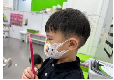
數一數五官的數量