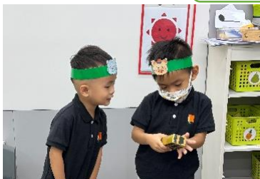
小動物爭相想玩玩具。