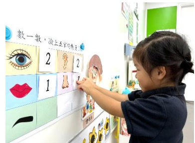
操作教具拼砌五官