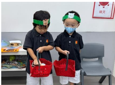
小動物弄丟了自己的食物。