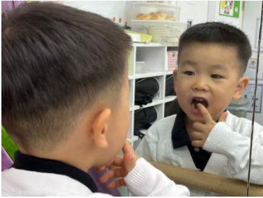
照鏡觀察五官的位置

幼兒看著鏡子，認真觀察自己的樣子和五官的位置，他們發現自己的五官與其他幼兒不一樣，每位幼兒的樣子都是獨一無二的。他們又數一數五官的數量，重溫 1 和 2 的數與量概念。