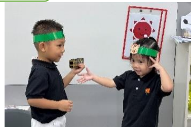
一起輪流玩遊戲吧！