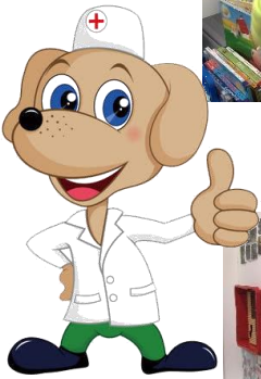
狗醫生可以為有需要人士帶來歡樂