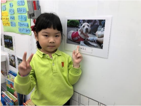
導盲犬可以為視障人士帶路

幼兒認識了不同種類的狗隻後，亦了解到狗隻是人類的好朋友，在日常生活中更會幫助人類解決和處理不同的工作，有很大的貢獻。