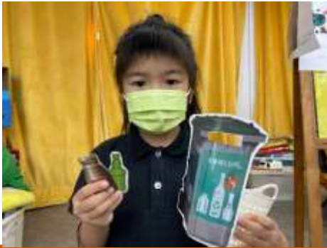
玻璃樽可以放在綠色回收箱