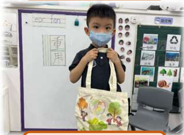
購物時使用環保袋