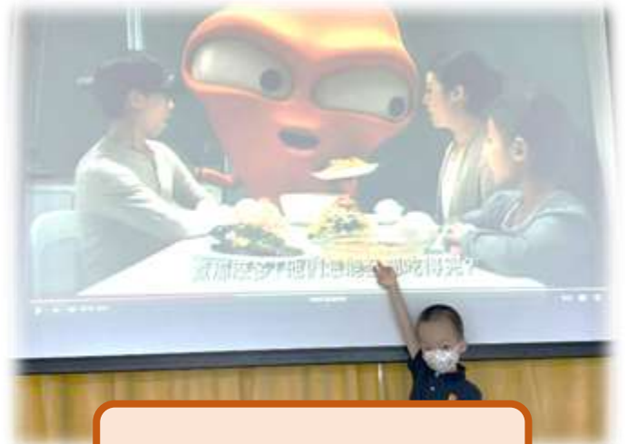
珍惜食物，不要做大嘍鬼