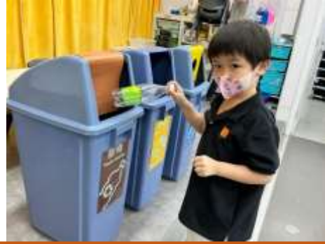
膠樽可以放在啡色回收箱