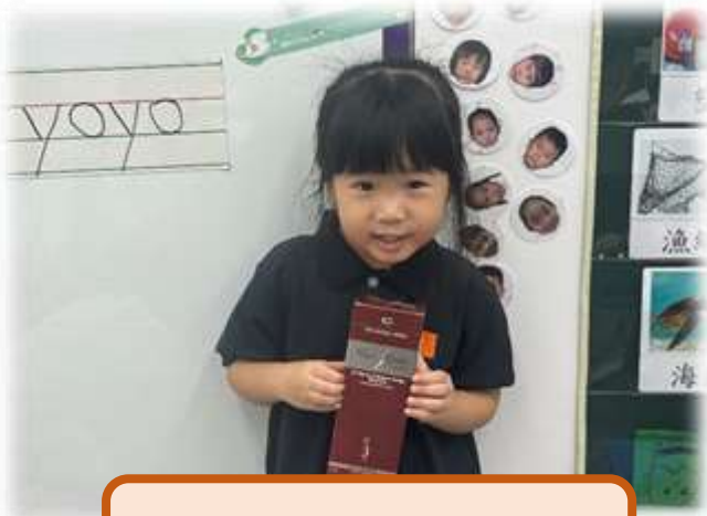
紙盒可以循環再用