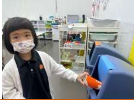
紙杯可以放在藍色回收箱