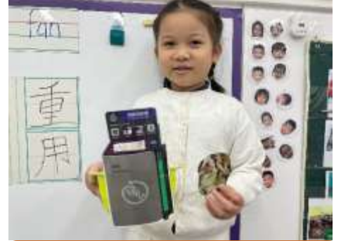
廚餘可以放進廚餘機