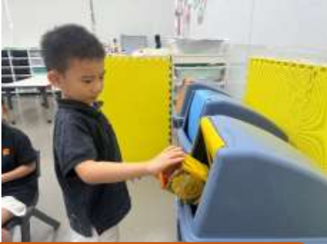
鋁罐可以放在黃色回收箱

幼兒透過活動和生活經驗，分享不同回收箱的類別，例如：黃~鋁罐、啡~膠樽、藍~廢紙等。看一看它們的功用吧~