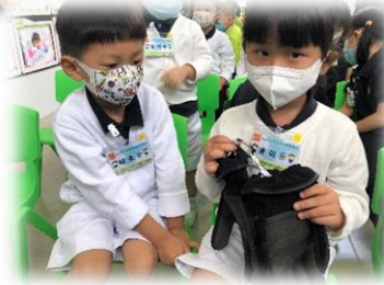
幼兒穿上消防員的服飾裝備，扮演小小消防員。