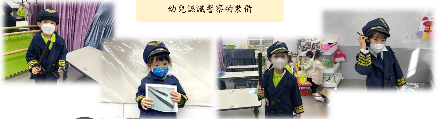
幼兒認識警察的裝備

在主題書中，幼兒亦對警察的工作感到好奇，並表示長大後希望成為警察保護市民。幼兒認識警察的工作後，穿上制服模擬執行各種任務，維持秩序和幫助市民！