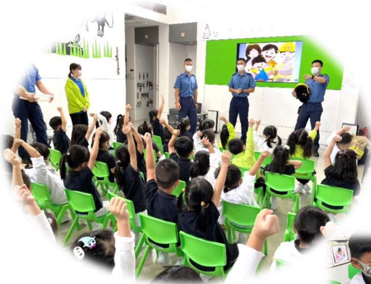
消防員向幼兒分享日常的工作及服飾裝備

為了豐富幼兒對不同職業的認識，本校邀請消防義工到校與幼兒進行「幼兒消防安全講座」，分享消防員的工作及裝備。幼兒亦嘗試穿上不同的消防員服飾，扮演小小消防員！