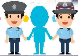
幼兒投入扮演警察的角色，為市民服務。