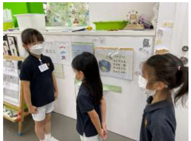
風紀負責維持秩序