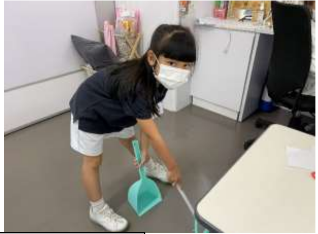
值日生協助整理課室