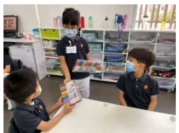
班長幫忙派作業及用品給同學。