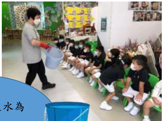
姐姐用水桶裝水為 烏龜更換清水