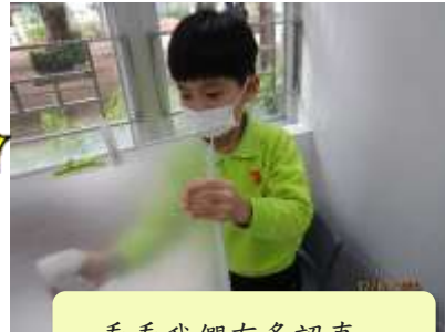
看看我們有多認真。