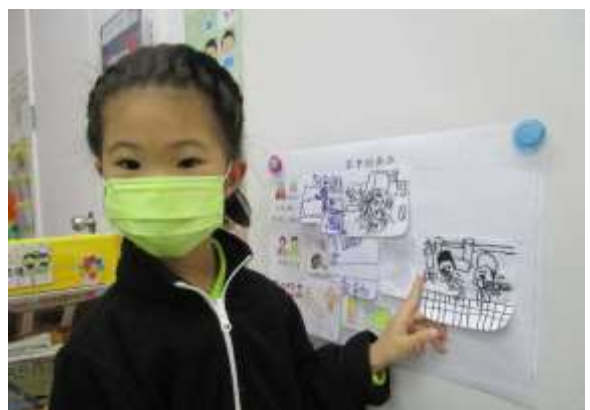
家晴：「媽媽會送我上學。」