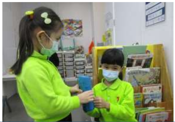
浣淇：「我們可以給長者喝一點熱茶。」