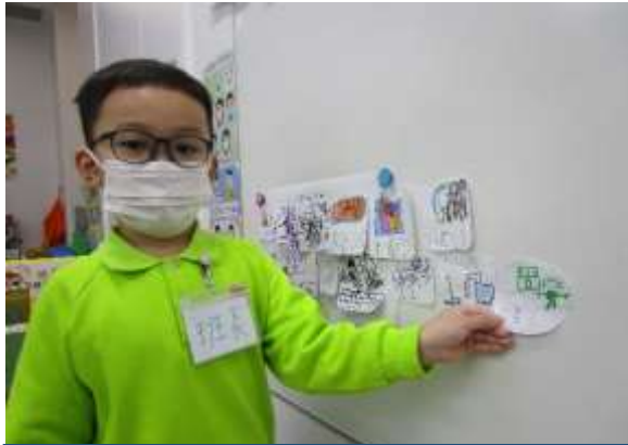
諾政：「我會和媽媽去買東西。」

幼兒學習到要關心自己的家人，分享了不同家庭成員在家裏的角色，例如：媽媽負責做家務、爺爺會幫忙買菜、爸爸負責上班工作等，體會到各人的辛勞。