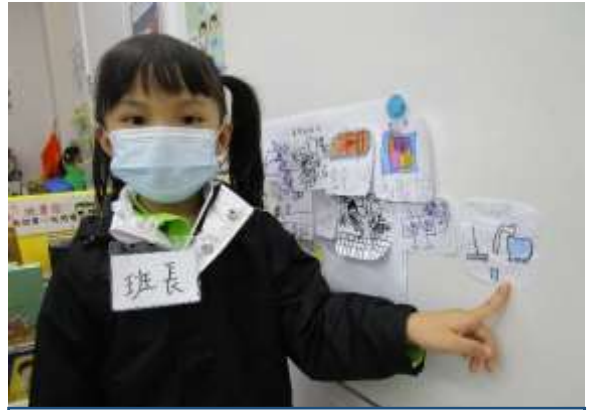
仲嘉：「媽媽會做家務。」