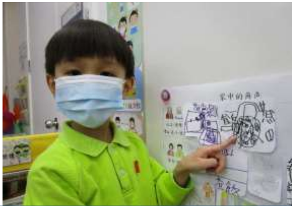
文穎：「公公煮飯給我吃。」