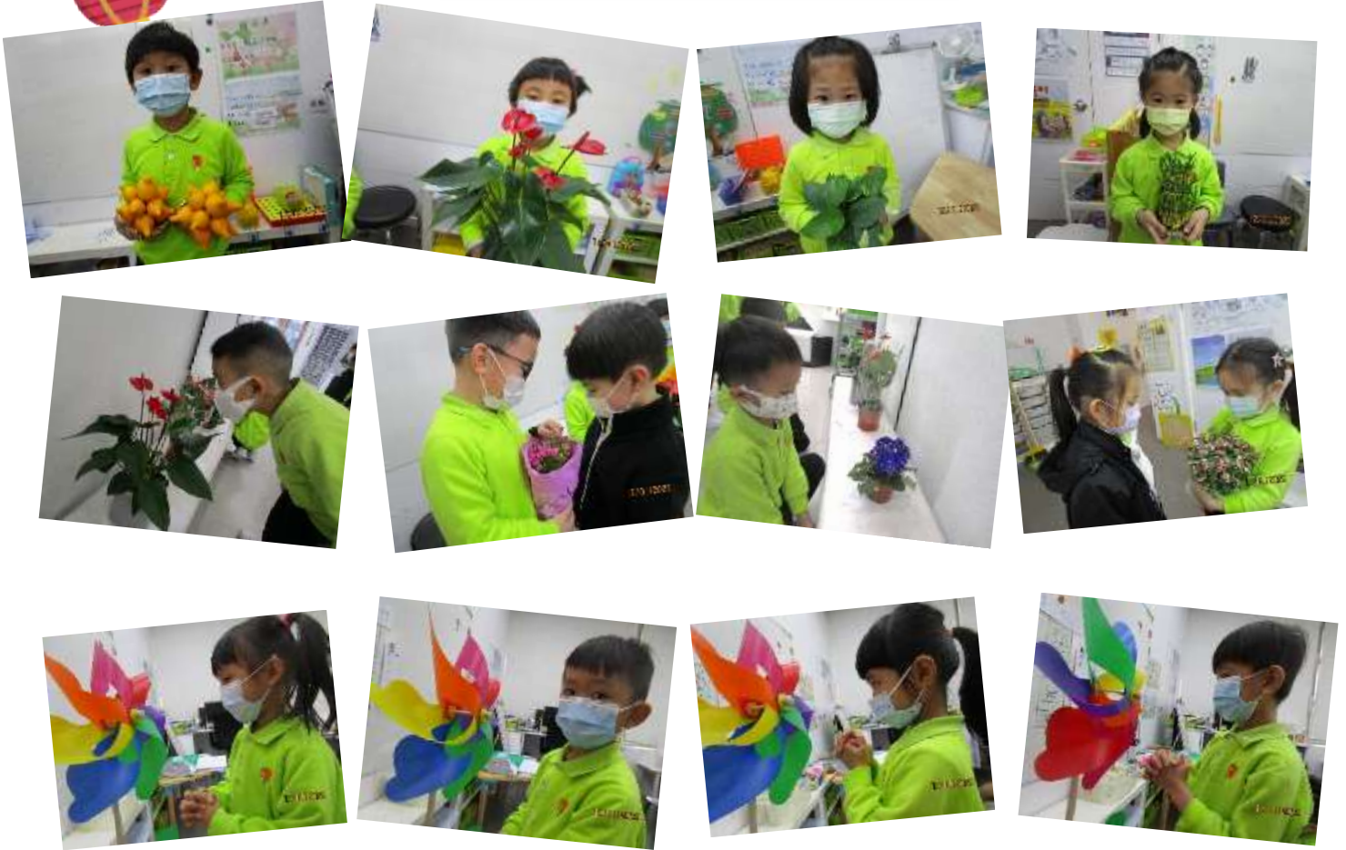
新年舞龍、願望桔及老虎帽子圖工