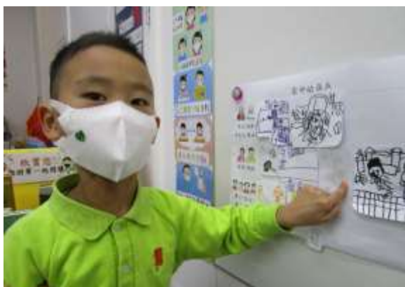
少軒：「媽媽會煮飯給我吃。」