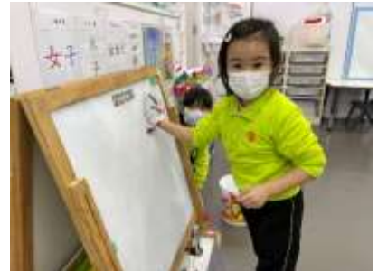
看看我們有多認真。