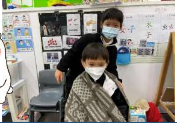
普欣：「幫他們披上保暖的披肩。」