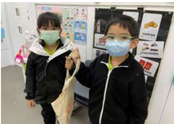
亮均：「我們可以幫他們拿一些輕便物品。」