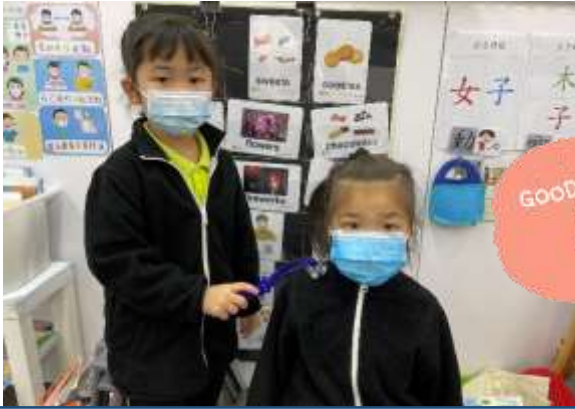
泳心：「我們可以幫長者按摩。」