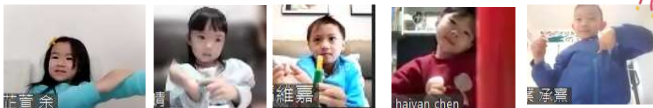
財神和大家拜年，祝賀新年！