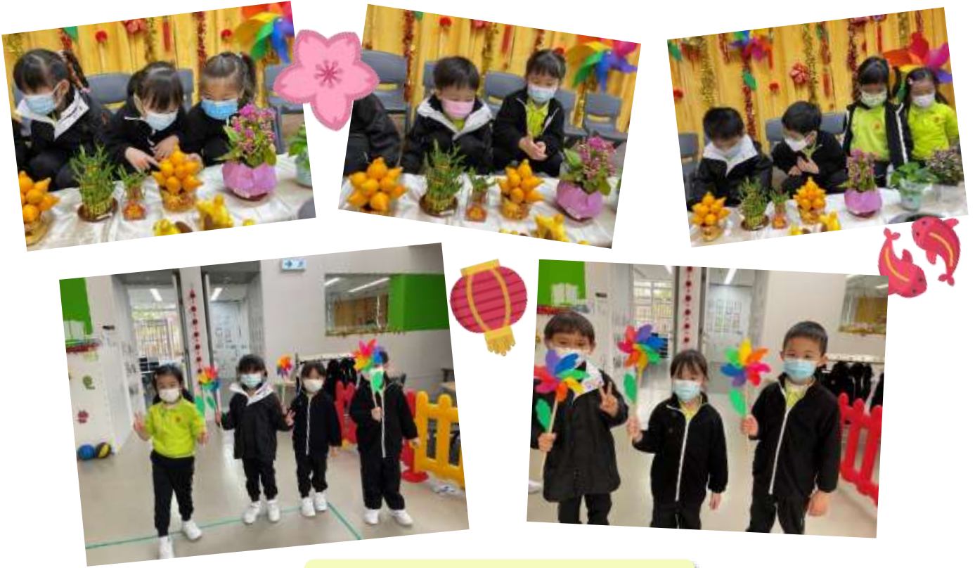
新年舞龍、願望桔及老虎帽子圖工