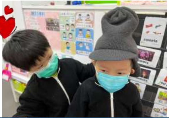
振濤：「可以幫長者戴上保暖的冷帽。」