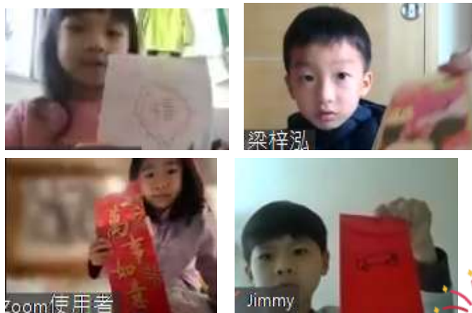
遊戲二：新年碰碰樂