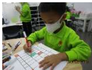
題目：《美國》 作者：馮維嘉