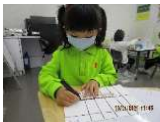
題目：《熊毛巾》 作者：劉仲嘉