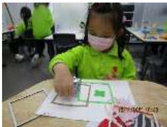
題目：《間尺》 作者：王心蔚