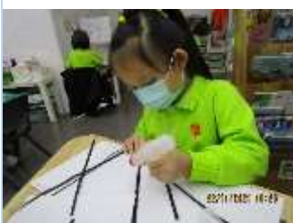
題目：《色熊》 作者：王心蔚