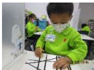
題目：《英國》 作者：馮維嘉