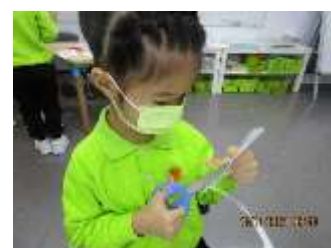
題目：《水果》 作者：卓家晴