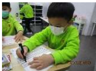
題目：《風葵小號》 作者：羅諾政