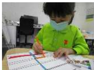
題目：《我的作品》 作者：盧慧卿