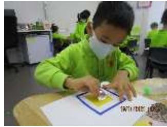
題目：《小淇子冰》 作者：葉少軒