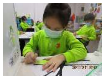
題目：《老鼠畫家》 作者：張浣淇