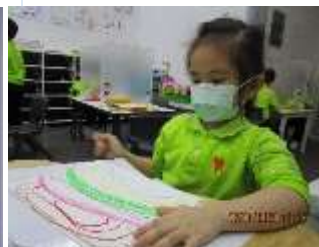
題目：《曲奇餅》 作者：張浣淇