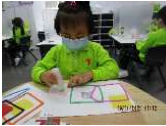
題目：《靚畫》 作者：林俞欣