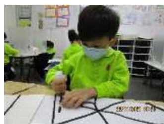
題目：《彩色》 作者：熊俊豪