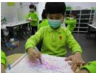
題目：《立站》 作者：林澤銘