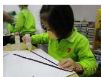
題目：《小熊》 作者：余雅雯