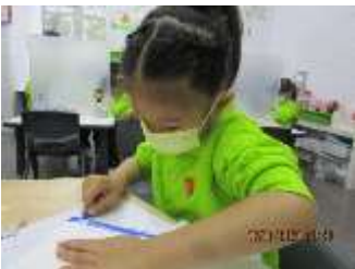
題目：《災難》 作者：卓家晴