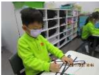
題目：《魔鬼熊》 作者：吳栩然