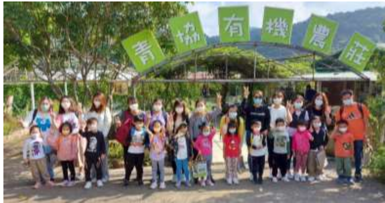
認識有關植物的小知識

在親子旅行日，家長與幼兒到達青協有機農莊，透過導賞員的分享，一起認識農莊裡的動植物，又親身體驗耕種的樂趣，大家更走到水塘欣賞大自然的景色，渡過了快樂的一天。