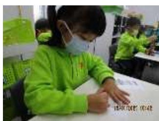
題目：《動物餅》 作者：劉仲嘉