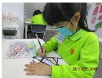
題目：《彩色線》 作者：盧慧卿