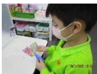
題目：《好味》 作者：吳一言