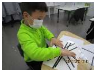
題目：《歡喜》 作者：羅諾政