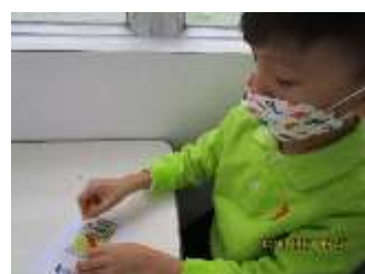
題目：《好好味的益力多》 作者：熊俊豪