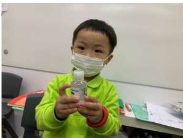
馬化騰 ：「這是我的搓手液。」