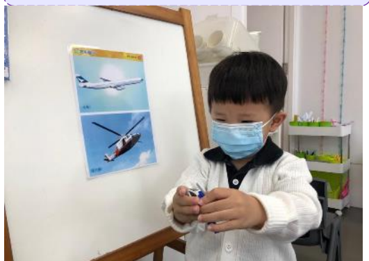
蔣晉宇：「飛機可以飛上天。」