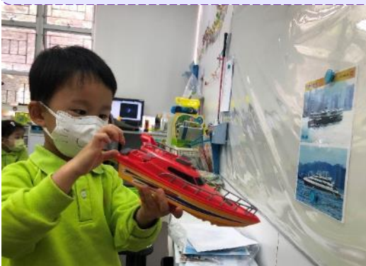
邱環約：「噴射船在海上航行。」