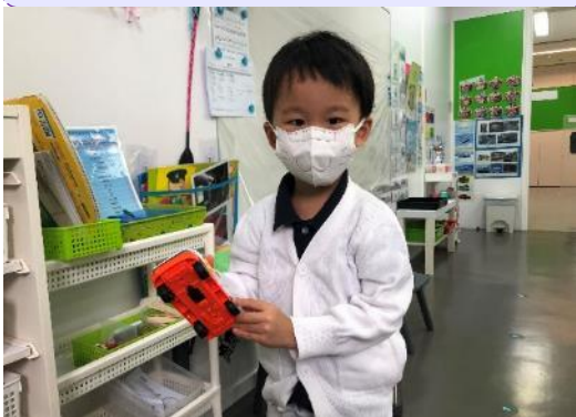
邱環約：「這架消防車有四個輪子。」