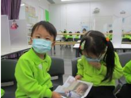
邱環約 ：「我小時候是不是可愛？」

透過主題故事《這是我》，幼兒了解到自己和達達一樣長大了。於是，幼兒彼此分享自己的嬰兒照片。再次感謝家長為幼兒預備照片回校作